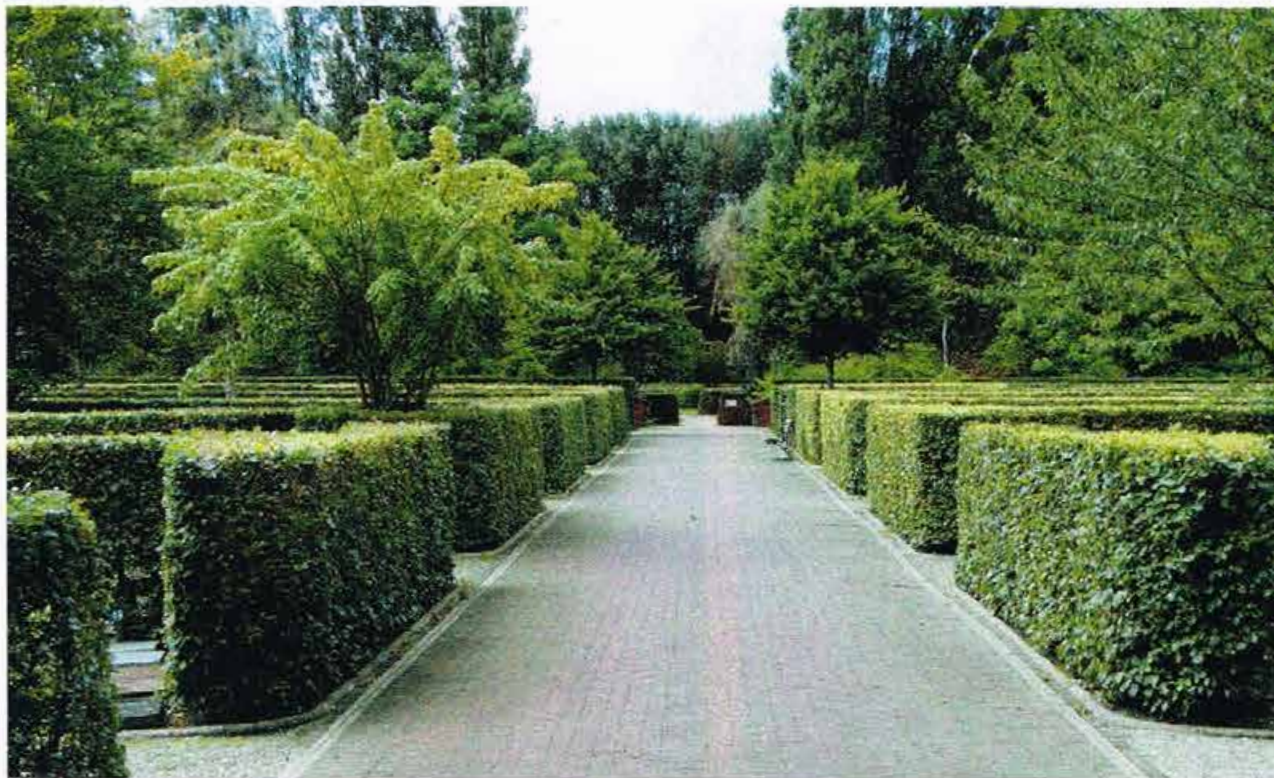
Op Veldheim, het nieuwe deel van de begraafplaats geven beukenhagen ( Fagus sylvatica ) structuur. Ze zijn gesnoeid op een hoogte die ook enige privacy biedt.